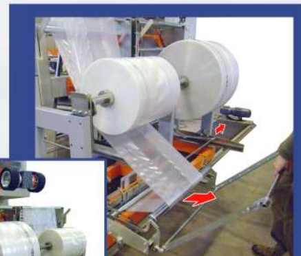
PORTABOBINA ESTRAIBILE EXTRACTABLE COIL HOLDER

The OMS stretch hooding machine IS46 is an automatic machine which uses a single work station for packaging operations using stretch film. The IS46 stretch hood machine has been designed for a high performance ( up to 240 pcs/hr ) while keeping a high quality of the packaged product. With its innovative coil holder it is possible to prepare the coil which will go into operation without having to stop the machine. For maintenance purposes, the operator can totally and easily access the machine's sensible areas since they are all either at ground level or can be reached from the ground.